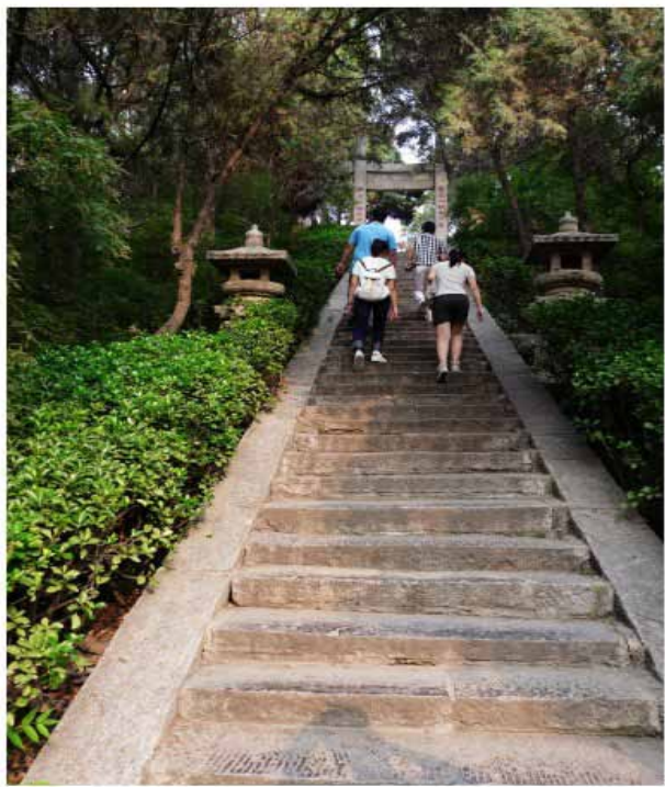
走过一段长长的台阶 我们向着墓体区进发