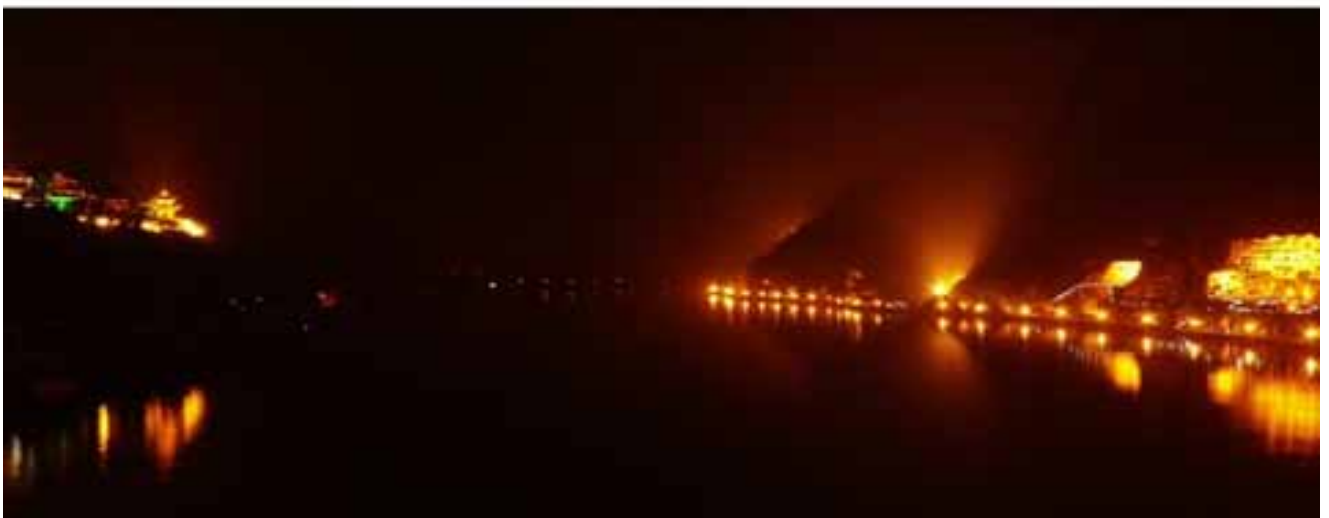
灯火辉煌的两岸之间 伊河静静的流淌