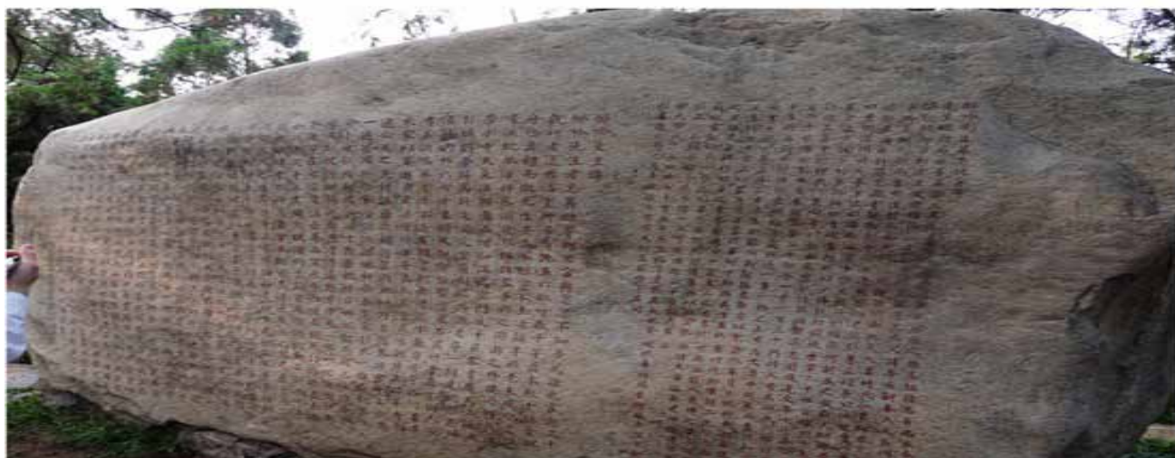
卧碑——醉吟先生传（仿品）