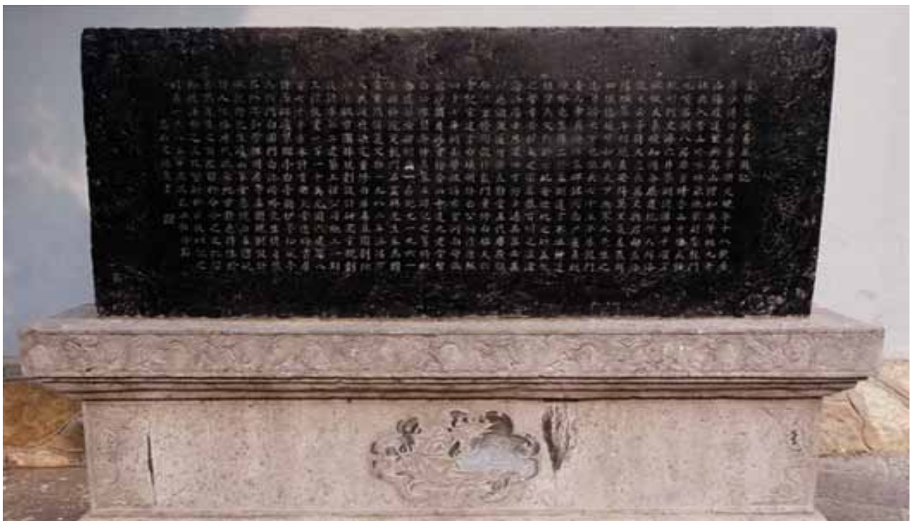
图为重修白居易墓园的题记

白园位于市南 12 公里的龙门东山琵琶峰上，占地 44 亩，是以唐代大诗人白居易墓地为基础修建的公园。园内可分为青谷区、墓体区、诗廊区、管理区四部分青谷区自然风光秀丽，两侧都是高高的绿竹，主要景点有乐天堂、听伊亭、松冈亭等，白居易的塑像就在乐天堂内。