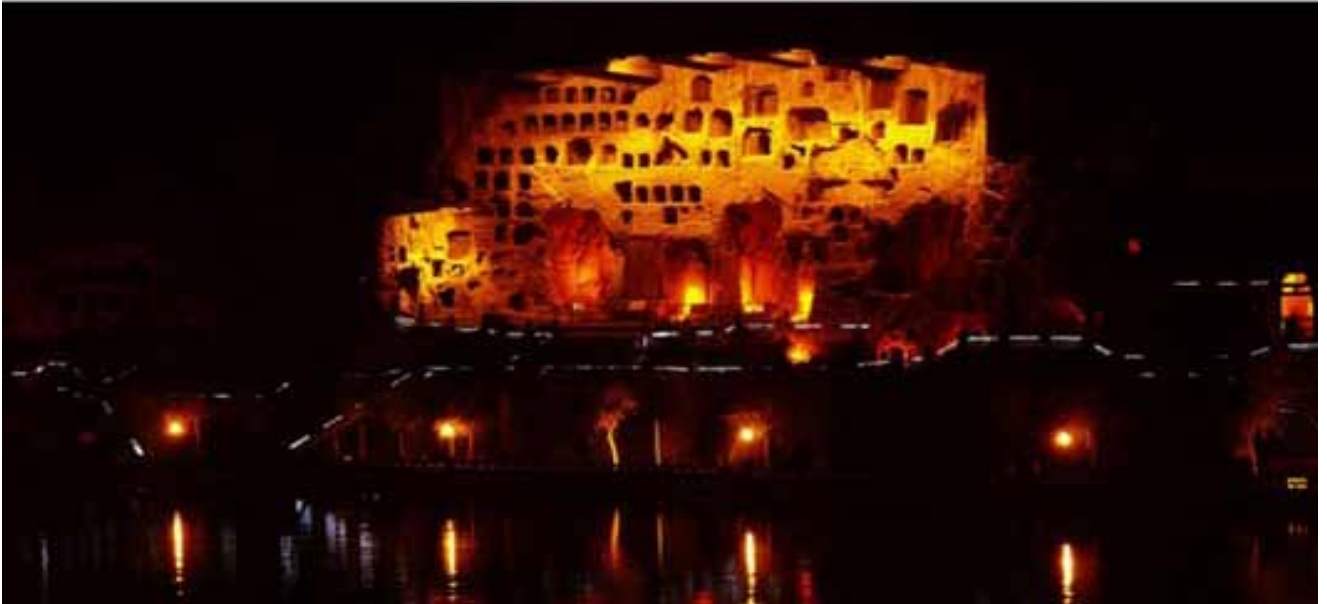
夜色中的奉先寺丢掉了历史的古味 增添了一番别样的诱惑