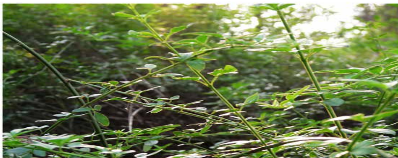
半球形墓冢周围被迎春花环绕