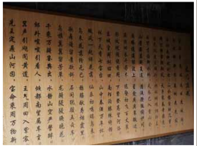
宋之问当时所作的龙门应制