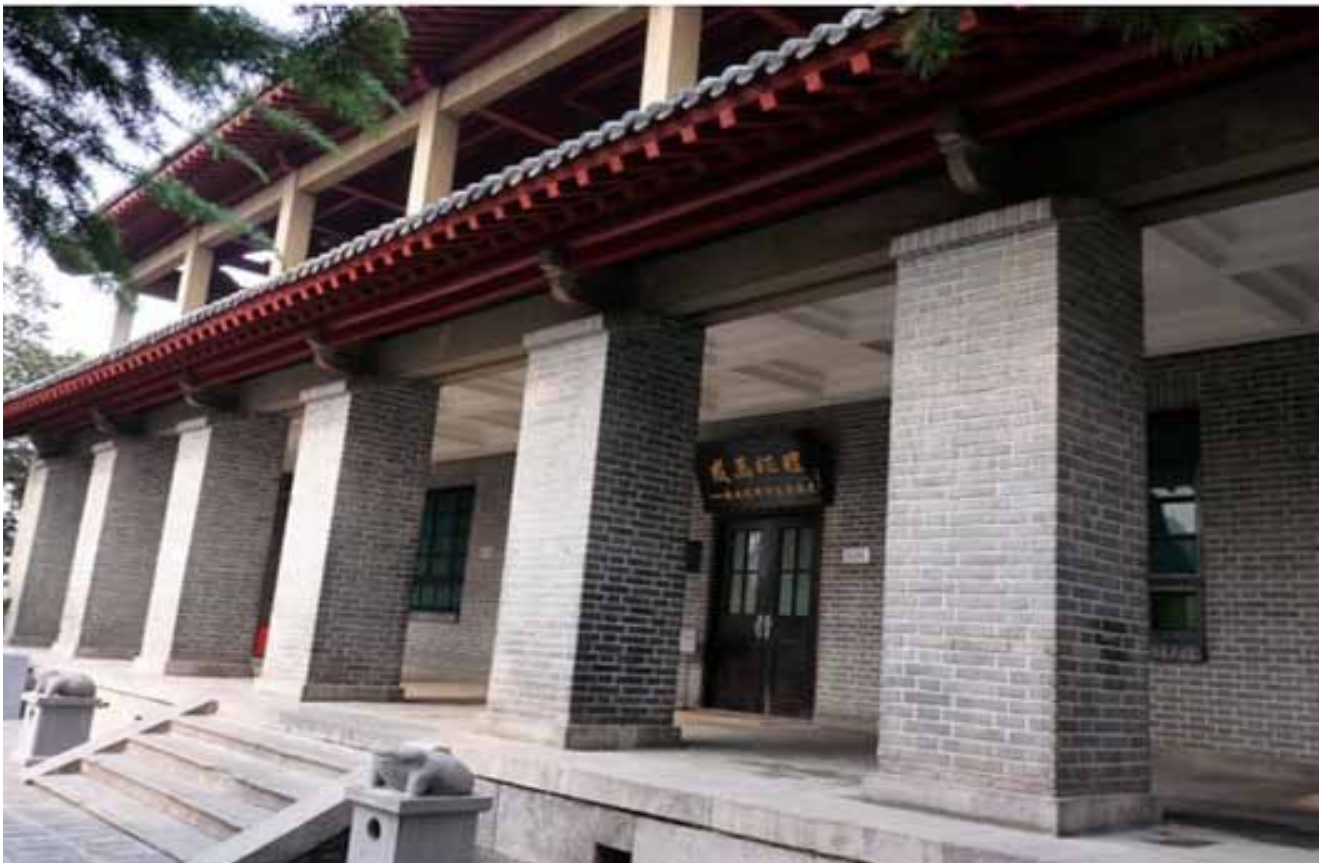
杨成武将军及家人遭囚禁的阁楼二年之久