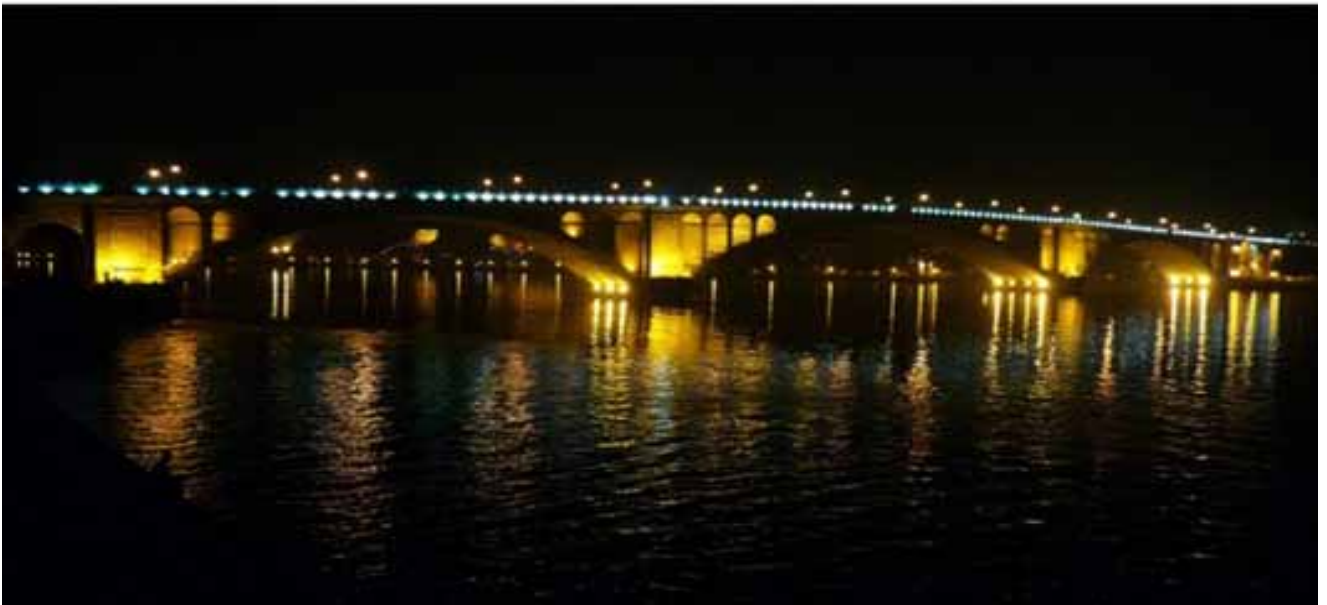
龙门夜色——仿赵州桥而建的 17 孔桥