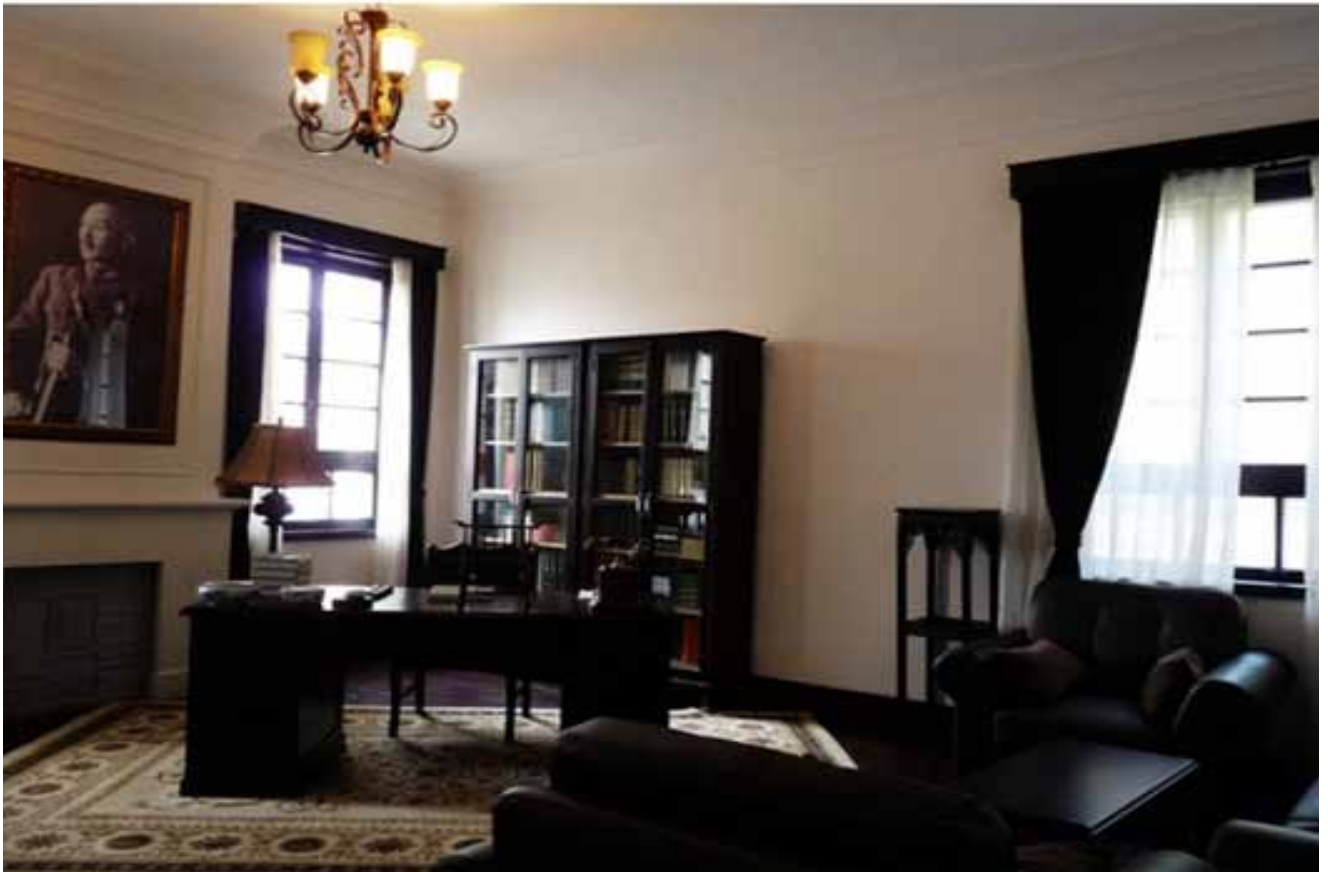
蒋宋别墅——蒋介石的“别墅”，杨成武的牢狱