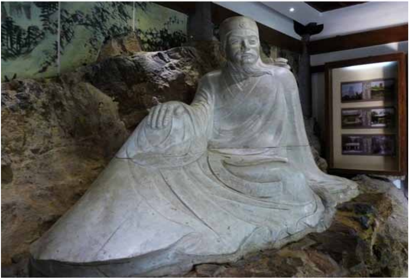
乐天堂内的白居易雕像