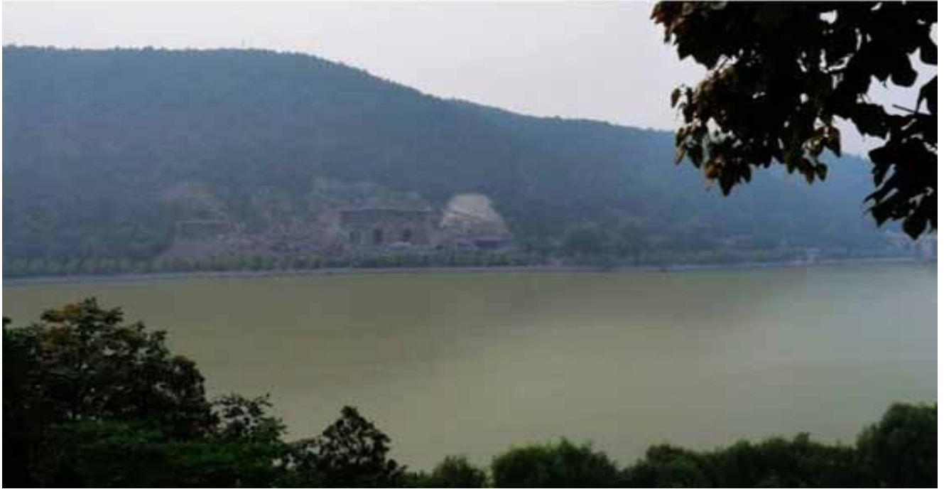
等高远眺 对面龙门石窟全景清晰可辨 壮阔非常

“龙门凡十寺，第一数香山”——位于东山山腰上的香山寺，始建于北魏熙平元年(公元516年)，其建筑古朴浑厚，掩映于苍松翠柏之中。唐文宗太和六年(公元832年)，白居易将给密友元稹撰写墓志铭的润笔费，捐修香山寺，并撰写了《修香山寺记》。名人名山名寺，相得益彰，使寺名大振。白居易还把自己在洛阳12年所写的八百首诗，编为十卷，取名《白氏洛中集》，放在香山寺藏经堂内。白居易曾常住寺内，自号“香山居士”。白居易死后家人便把他埋葬于此。